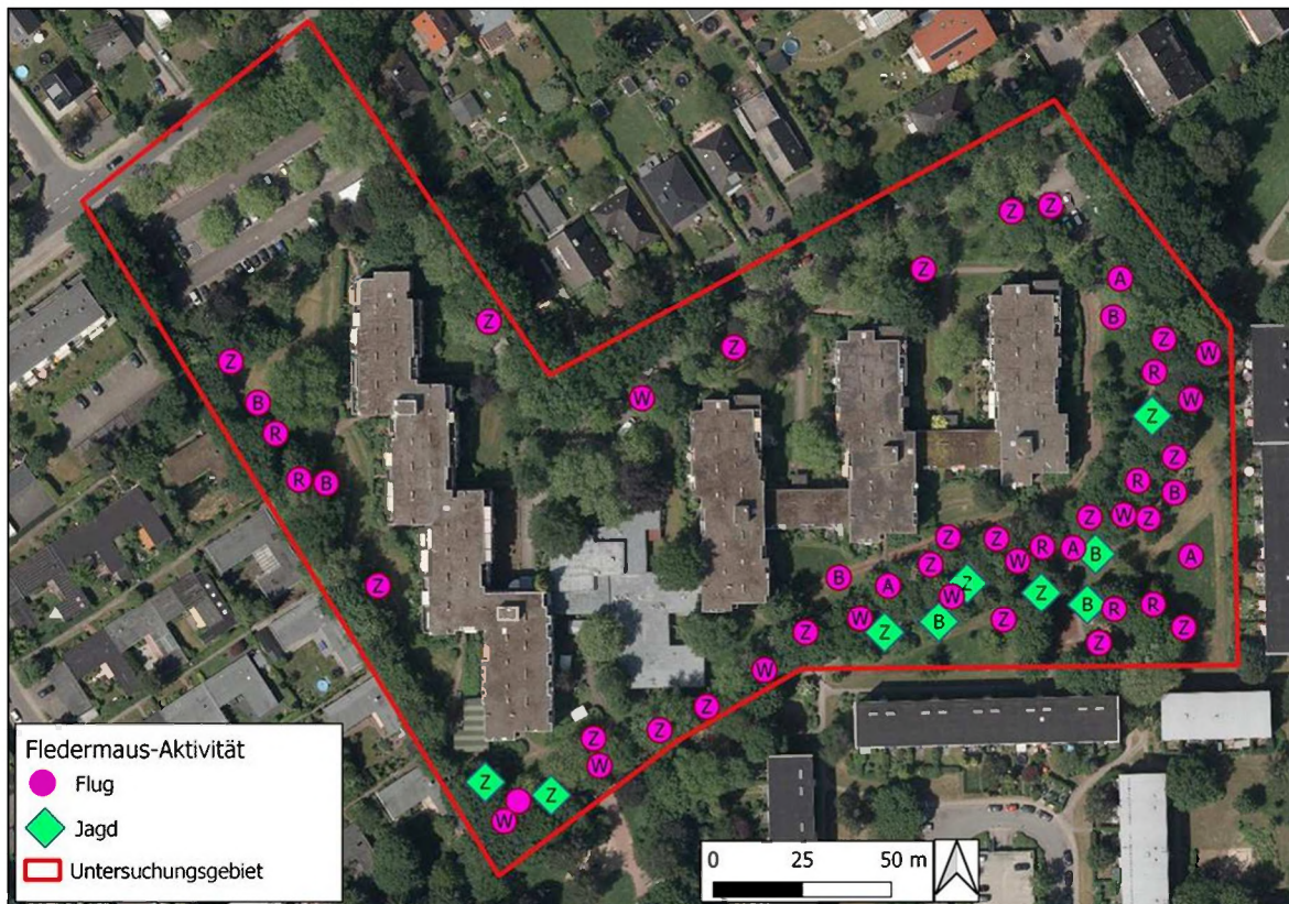
Abbildung 4: Art der Fledermausaktivität im Untersuchungsgebiet