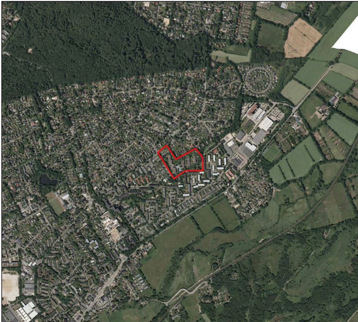
Abbildung 1: Lage der untersuchten Fläche mit Umgebung (Luftbild aus Datenlizenz Deutschland – Freie und Hansestadt Hamburg, Landesbetrieb Geoinformation und Vermessung – Version 2.0)

In Rahlstedt soll bestehender Senioren-Wohnungsbestand abgebrochen und moderne Wohnungen neu errichtet werden. Neben bereits versiegelten, werden auch mit Vegetation bestandene Flächen überbaut oder für die Bauarbeiten beansprucht werden.