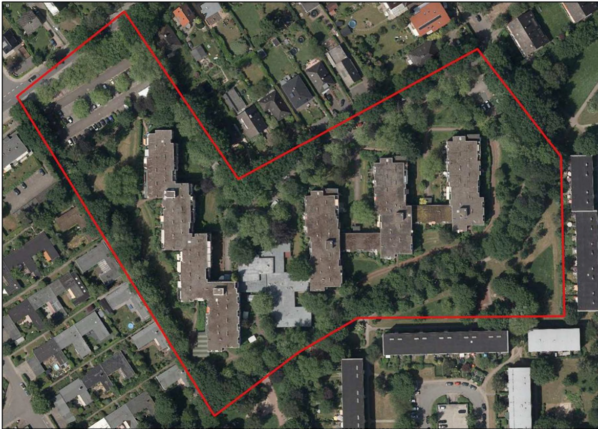
Abbildung 2: Untersuchungsgebiet (rote Umrandung). Luftbild aus Datenlizenz Deutschland – Freie und Hansestadt Hamburg, Landesbetrieb Geoinformation und Vermessung – Version 2.0

Das Untersuchungsgebiet ist ca. 4 ha groß (rote Umrandungen in Abbildung 2). Die Fläche umfasst die zum Abbruch vorgesehenen Häuser mit den Flächen, die für den folgenden Neubau in Anspruch genommen werden. Das Untersuchungsgebiet ist Teil einer dichter bebauten Gartenstadt nach MITTSCHKE (2012) mit ho-