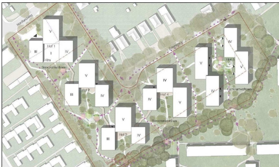
Abbildung 5: Entwurf – Studie (Stand: Februar 2021).

Eine vorläufige Planung sieht vor, die alten Gebäude zu entfernen. Dabei werden die meisten der Bäume innerhalb des Gebäudekomplexes entfernt. Die Bäume und Gehölze an den Südwest-, Südost- und Nordosträndern bleiben erhalten. Insgesamt ist damit zu rechnen, dass das Gelände innerhalb der Feuerwehrumfahrt fast vollständig mit Ausnahme einzelner Gehölzgruppen in der Bauzeit abgeräumt wird.